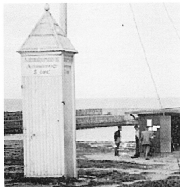
Vågen var strategiskt placerad vid flaggstången mitt på hamnplanen.